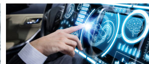
カーエレクトロニクス