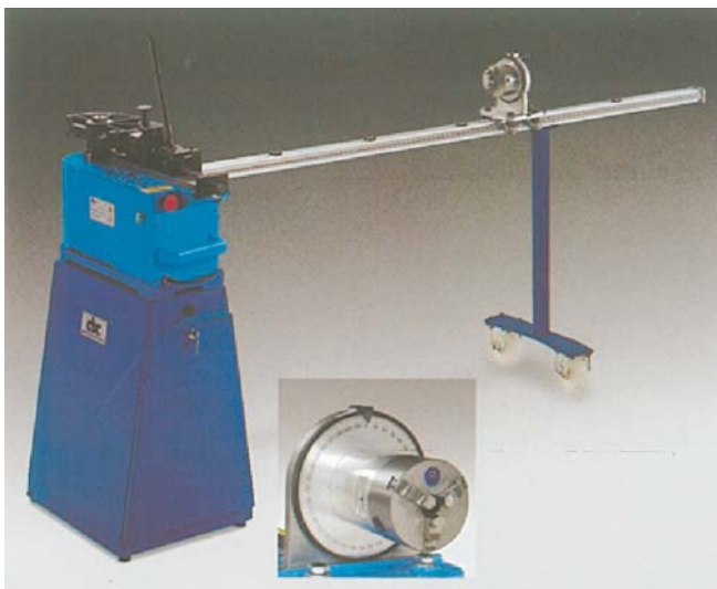
UNI 60A ユニバーサル・ベース上のパイプを様々な曲げることができる ムービング・ワーキング・テーブル付き