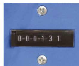
トータルカウンター